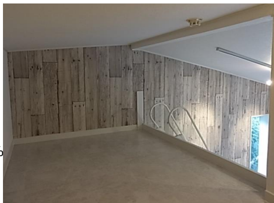
※現在リフォーム中